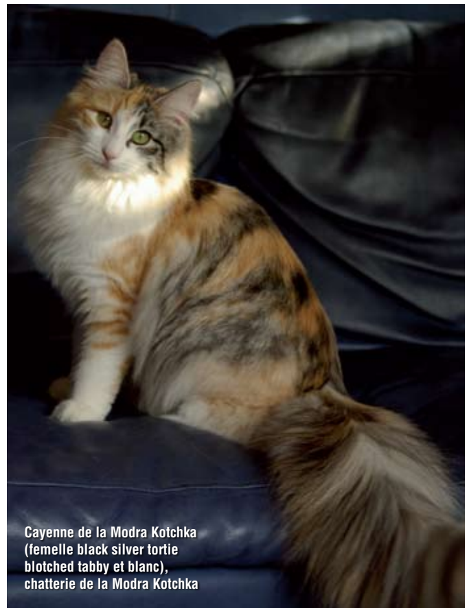
Cayenne de la Modra Kotchka (femelle black silver tortie blotched tabby et blanc), chatterie de la Modra Kotchka