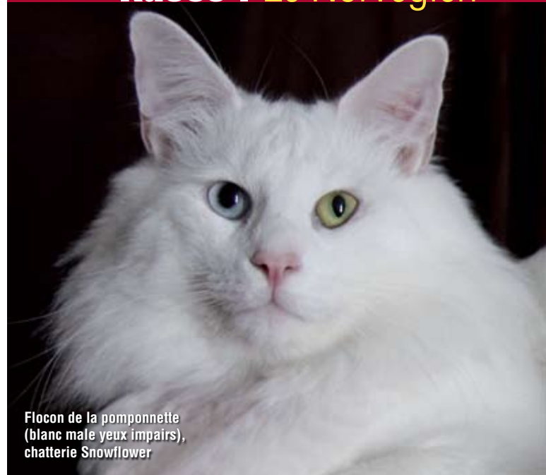
Flocon de la pomponnette (blanc male yeux impairs), chatterie Snowflower