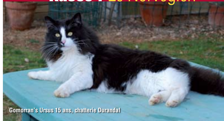
Gomorran's Ursus 15 ans, chatterie Durandal

La palette des couleurs est donc très large du tout noir au tout blanc, de l'uni au tabby (tigré), du roux à l'écaillé en passant par le smoke ou le silver (robe argentée) ou l'ambre. Quelque soit la couleur de la robe les yeux sont généralement or à vert, les chats blanc peuvent avoir les yeux bleu ou impairs.