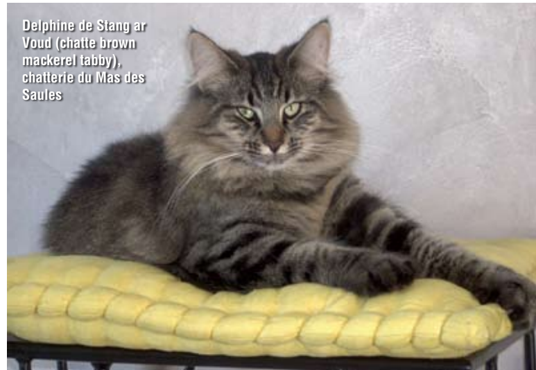
Delphine de Stang ar Voud (chatte brown mackerel tabby), chatterie du Mas des Saules