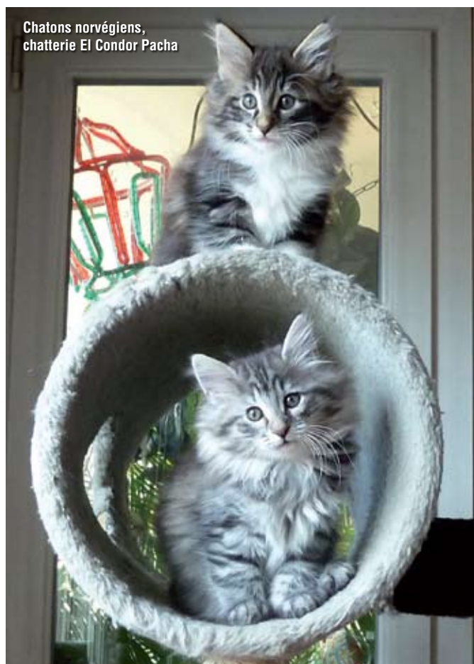
Chatons norvégiens, chatterie El Condor Pacha

Si vous habitez une maison avec un jardin, sachez le protéger des dangers de la vie citadine et des risques de promenades en campagne en limitant ses sorties. Les dangers de la vie en liberté ne font qu’abrèger son espérance de vie.