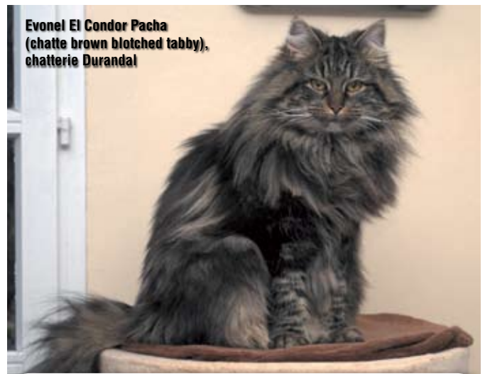
Evonel El Condor Pacha (chatte brown blotched tabby), chatterie Durandal