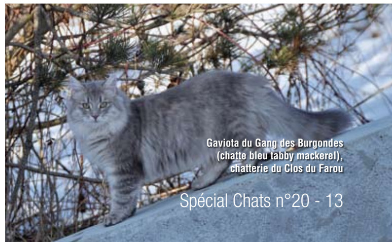
Gaviota du Gang des Burgondes (chatte bleu tabby mackerel), chatterie du Clos du Farou