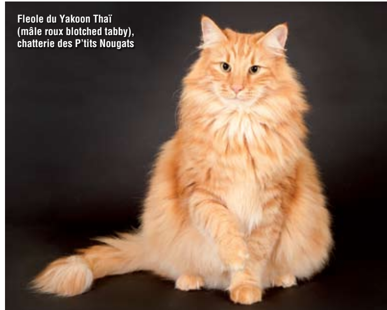
Fleole du Yakoon Thai (mâle roux blotched tabby), chatterie des P'tits Nougats