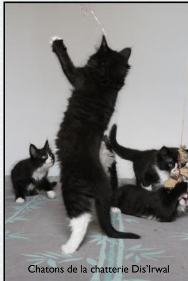
Chatons de la chatterie Dis'Irwal