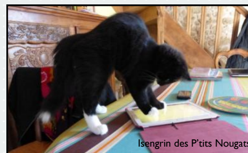
Isengrin des P'tits Nougats