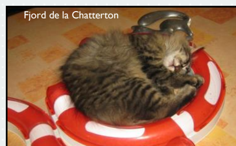
Fjord de la Chatterton