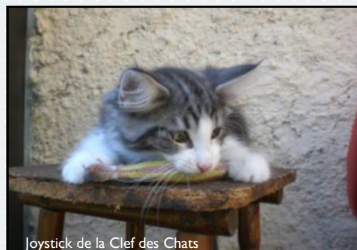
Joystick de la Clef des Chats