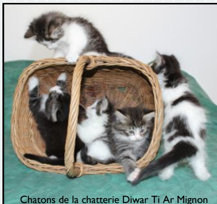
Chatons de la chatterie Diwar Ti Ar Mignon

Dans le cas d'un chaton unique, on veillera à ce qu'il ne soit pas séparé trop tôt de sa mère afin de lui garantir une bonne socialisation à son espèce.