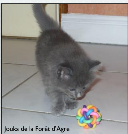
Jouka de la Forêt d'Agre