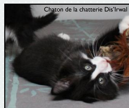
Chaton de la chatterie Dis'Irwal