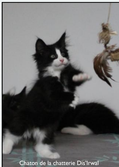
Chaton de la chatterie Dis'Irwal

Si le chaton peut jouer seul, il est important de jouer avec lui. Le jeu interactif n'est donc pas à négliger. La séance de jeu d'une durée de 10 à 15 minutes permet de nouer une relation privilégiée avec l'animal. Sachez varier les jouets parce qu'un chaton a besoin de stimulations et d'interactions pour bien grandir et devenir un chat adulte épanoui.