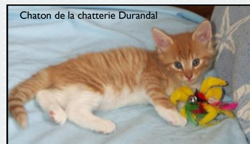
Chaton de la chatterie Durandal