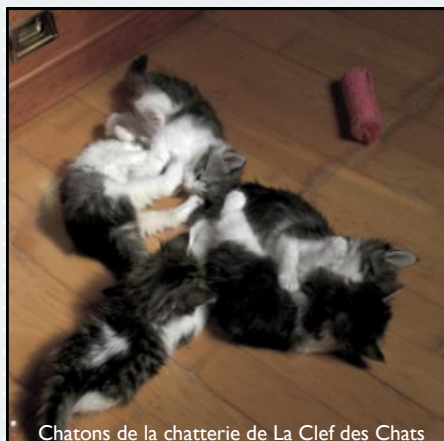
Chatons de la chatterie de La Clef des Chats