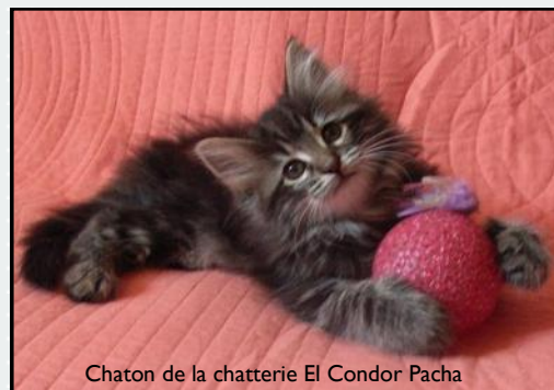
Chaton de la chatterie El Condor Pacha