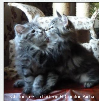
Chatons de la chatterie El Condor Pacha

« Le jeu est la principale activité des chatons. Il existe plusieurs formes de jeux : le jeu social, le jeu d'objet et le jeu interactif. Chacun de ces jeux a une fonction bien défini dans le comportement du chat. »