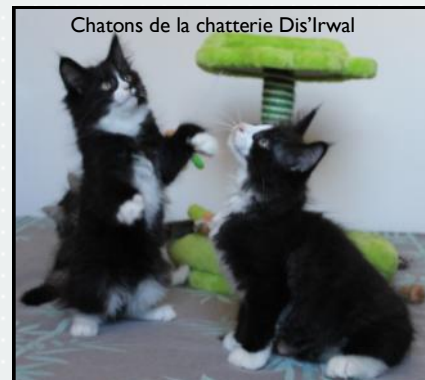
Chatons de la chatterie Dis'Irwal

« Les jeux entre chatons sont souvent considérés par les observateurs non avertis comme des bagarres. Mais en fait ils se terminent toujours amicalement. Jouer permet aux chatons d'apprendre à communiquer et à chasser, le tout de façon ludique. »