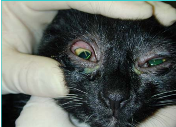
Conjonctivite unilatérale due à Chlamydophila felis.

La conjonctivite associée à un larmoiement intense est la manifestation clinique principale. Souvent unilatérale dans un premier temps, le deuxième œil est atteint quelques jours plus tard. Le larmoiement devient purulent* et la troisième paupière apparaît, masquant une partie de l'œil.