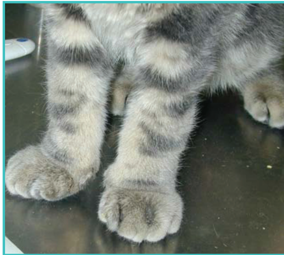
Œdème* des pattes avant chez un chat atteint de syndrome systémique sévère dû à un calicivirus.

Le taux de mortalité est variable, et peut aller jusqu'à 67 % des cas.