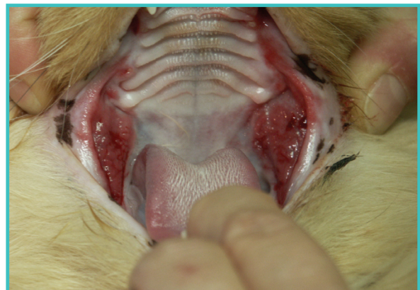
Lésions buccales dans une gingivo-stomatite chronique. Le calicivirus pourrait faire partie de l'association de facteurs responsables.

Ce complexe regroupe l'ensemble des affections buccales chroniques du chat. Cette atteinte est très difficile à soigner et son mécanisme mal connu. On pense néanmoins que le calicivirus pourrait être impliqué, car il est très fréquemment isolé chez les animaux malades.