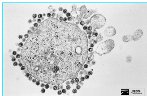
Globule blanc infecté par un rétrovirus : les particules virales libérées par les cellules forment une couronne périphérique.

Le traitement mis en place par le vétérinaire s'adaptera aux signes cliniques observés.