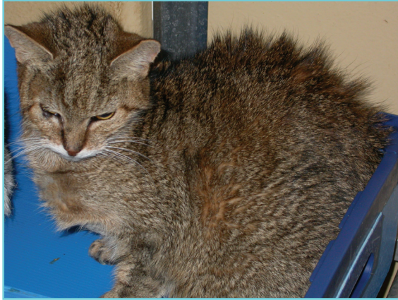
Chat atteint de rétrovirose, noter l'écoulement oculaire, l'attitude prostrée du chat, le poil hirsute.

Le diagnostic repose avant tout sur les éléments épidémiologiques* et les constatations cliniques réalisées par un vétérinaire.